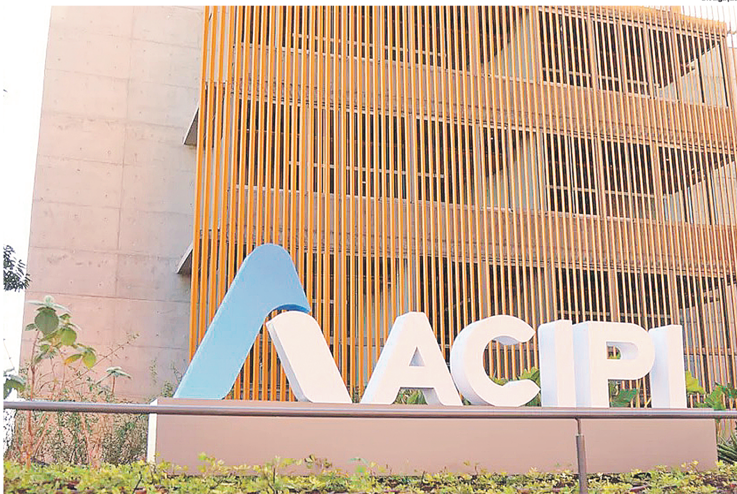
Acipi sediará o evento, que acontece na próxima segunda-feira, dia 11

"O Gigantes do Digital aproxima grandes empre-