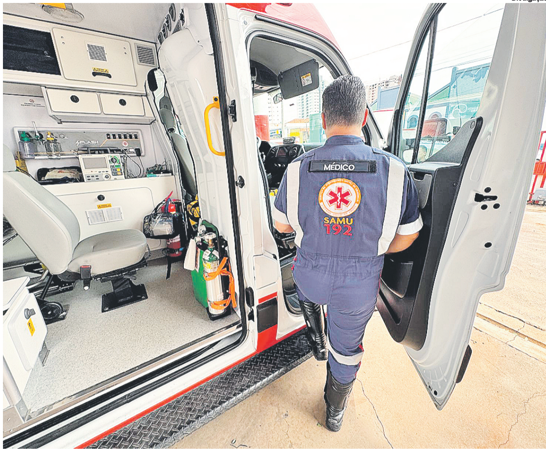
Samu e NEU ressaltam impacto dos acidentes nas famílias e reforçam atitudes preventivas

A maioria das vítimas segue o perfil observado no Estado e no país: homens